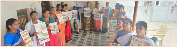
గుంటూరు, రక్షణ స్కూల్స్