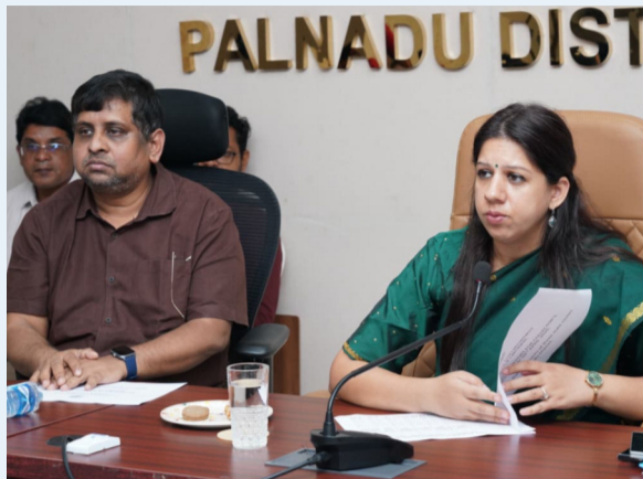
సర్పరావుపేట రక్షణ స్టూస్